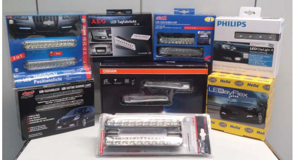
Tutti i prodotti sottoposti al test.

La differenza si nota: le luci diurne a LED sono ben visibili, con un consumo totale fino a 15 Watt a fronte dei 200 Watt delle luci anabbaglianti.